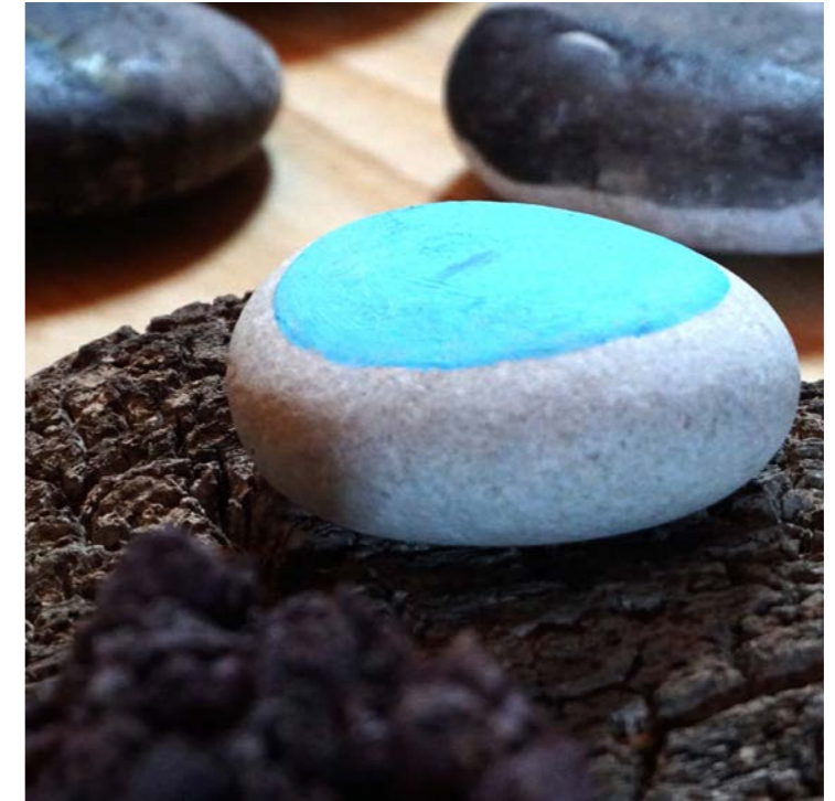
PIEDRA CIELO Acrílico sobre piedra

duermen los árboles enfía la piedra siento la noche