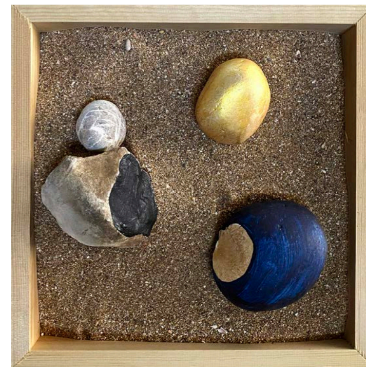
JARDINES DEL IMAGINARIO Acrílico sobre piedra

muros de piedra que separan la tierra guardianes de los árboles