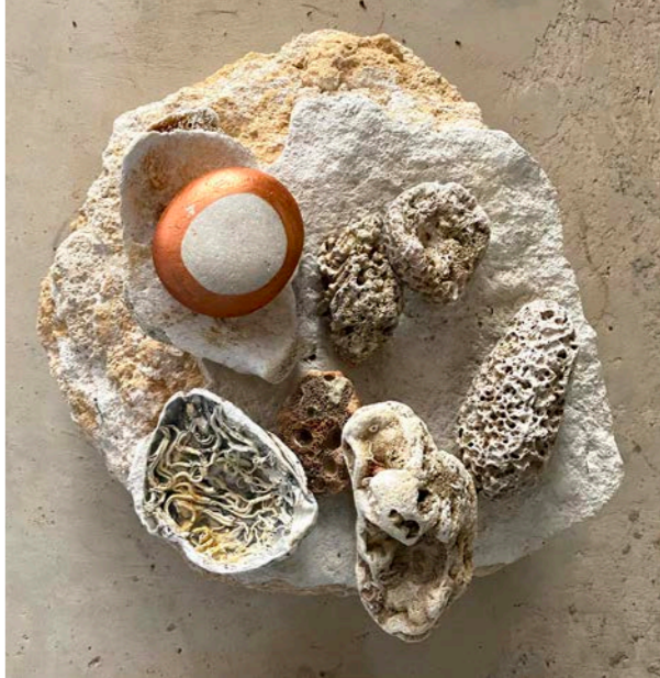
PIEDRAS QUE CONTIENEN PIEDRAS