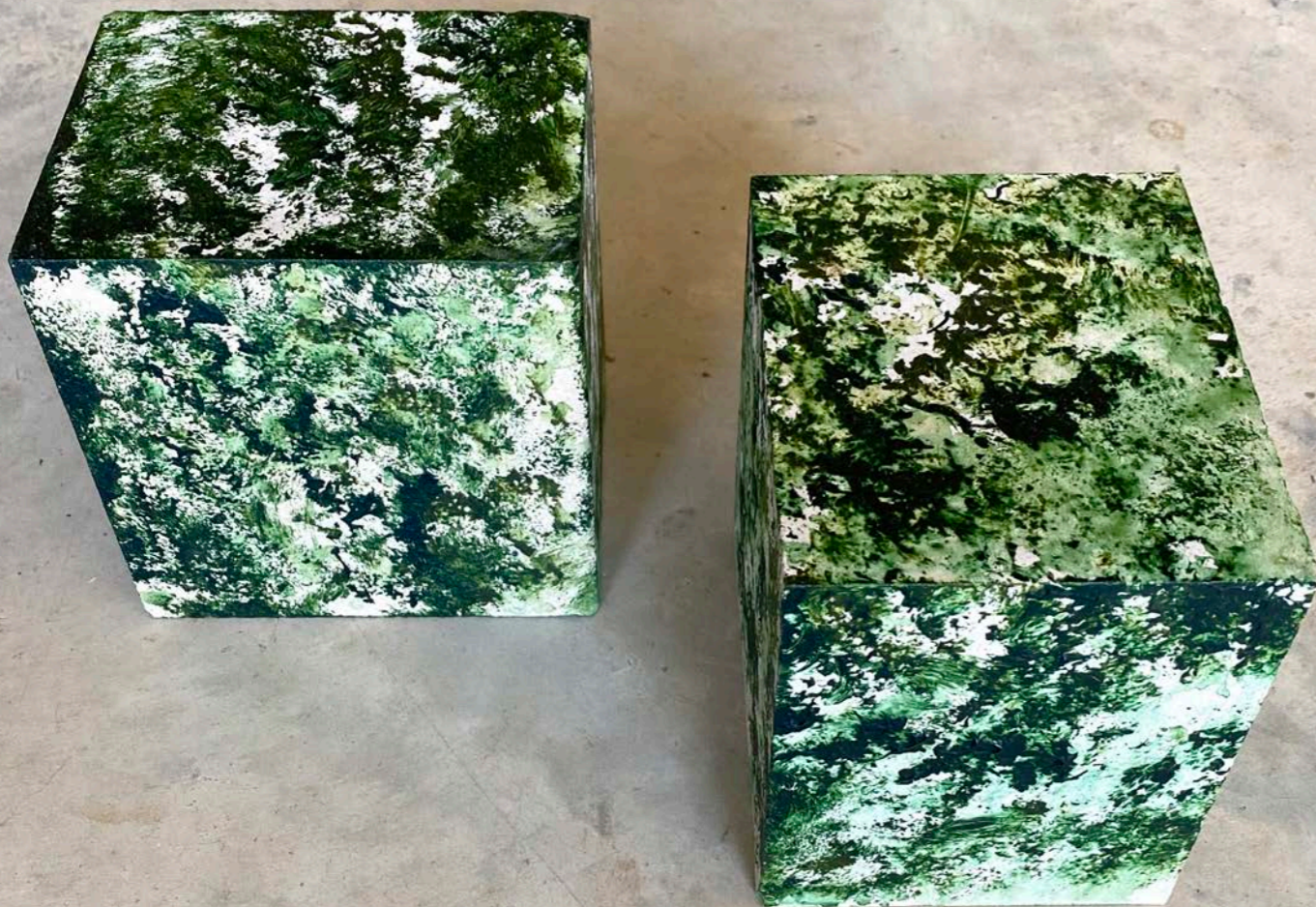
BOSQUE Acrílico sobre piedra

muros de piedra que separan la tierra guardianes de los árboles