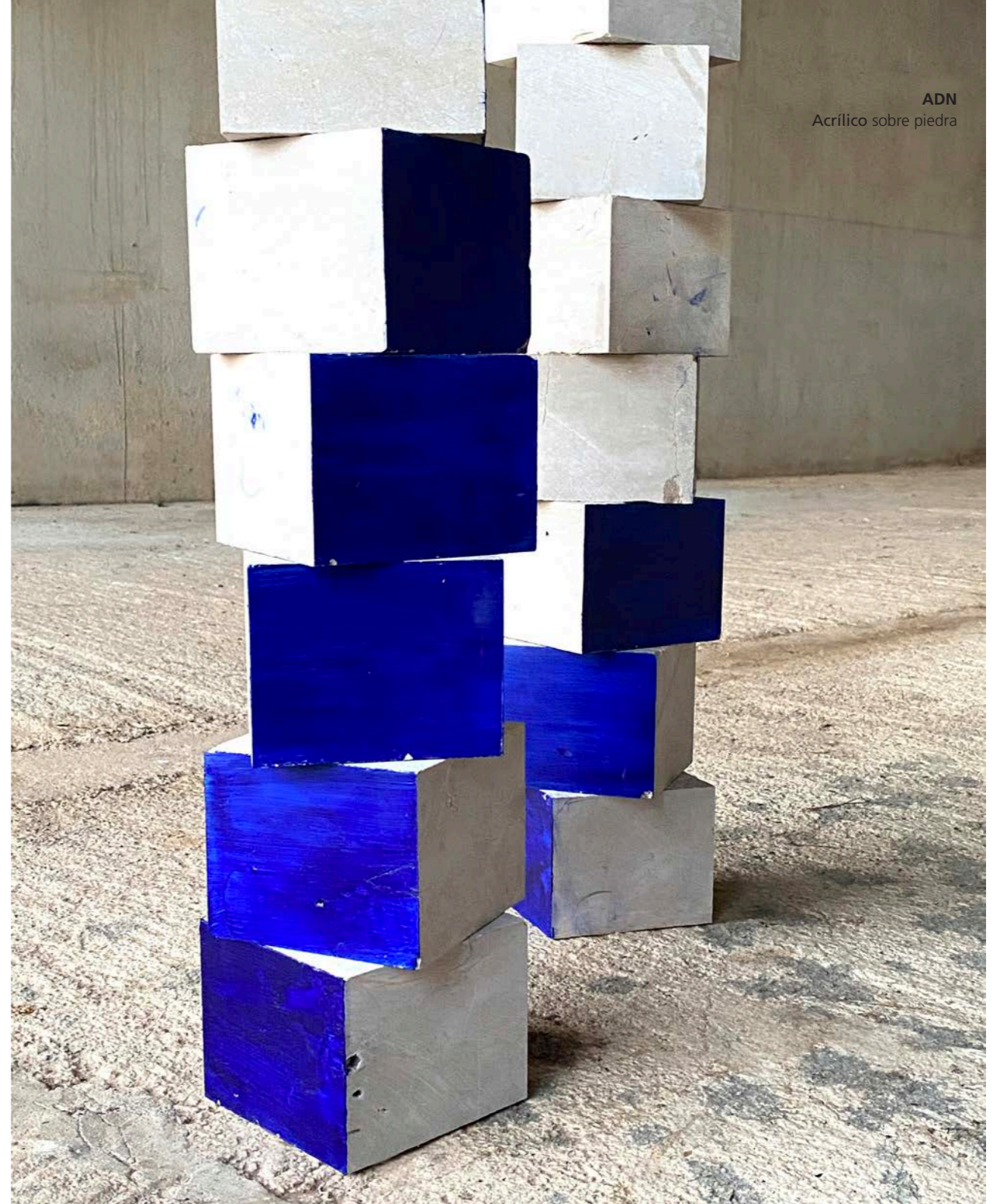
ADN Acrílico sobre piedra

pertenezco al agua voy y vengo la luna manda