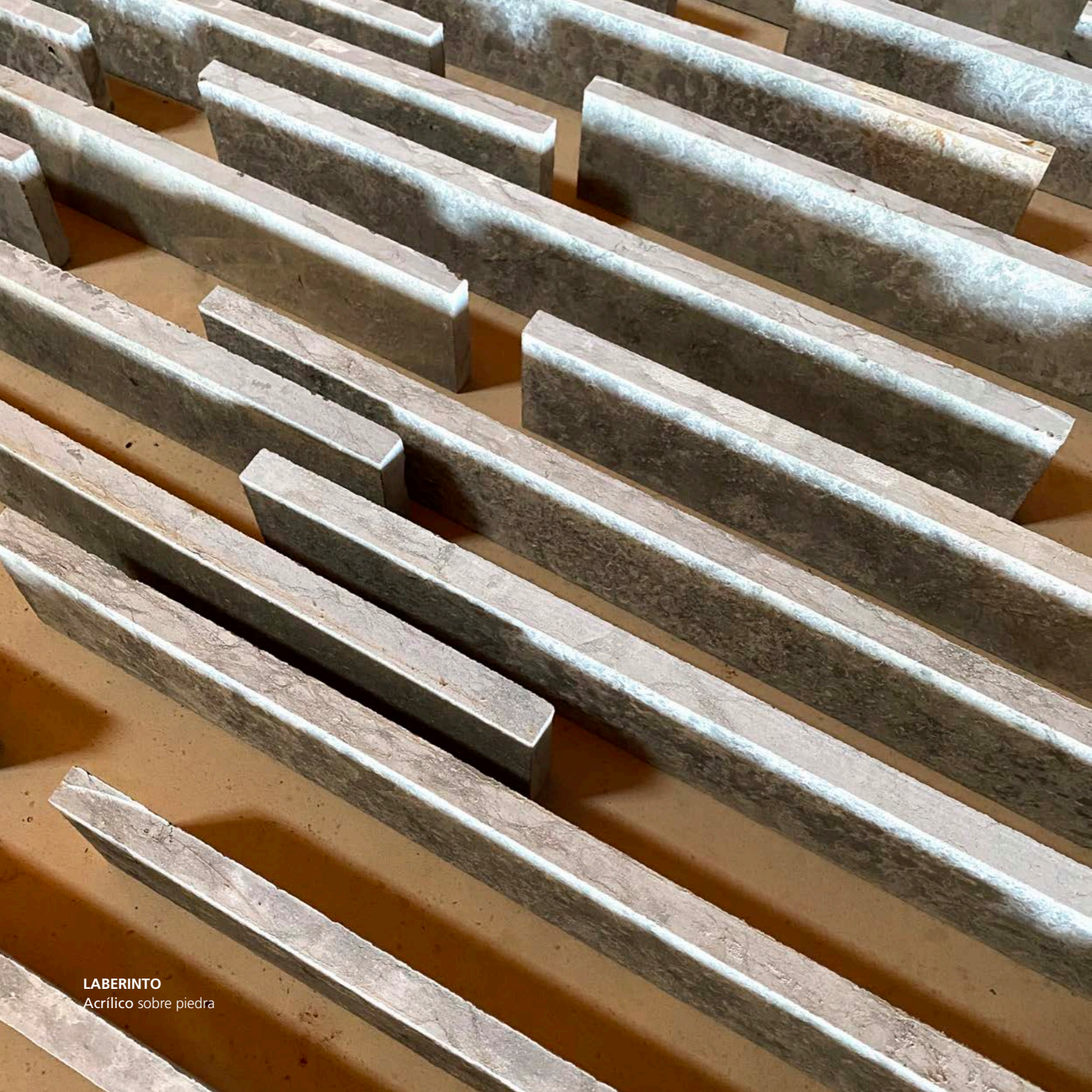
LABERINTO Acrílico sobre piedra