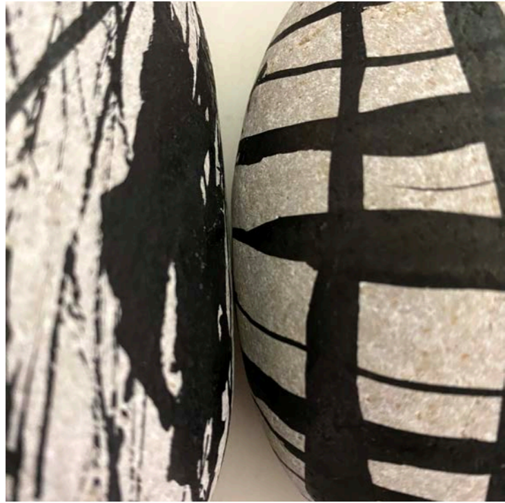
PAREJA Acrílico sobre piedra

pertenezco al agua voy y vengo la luna manda