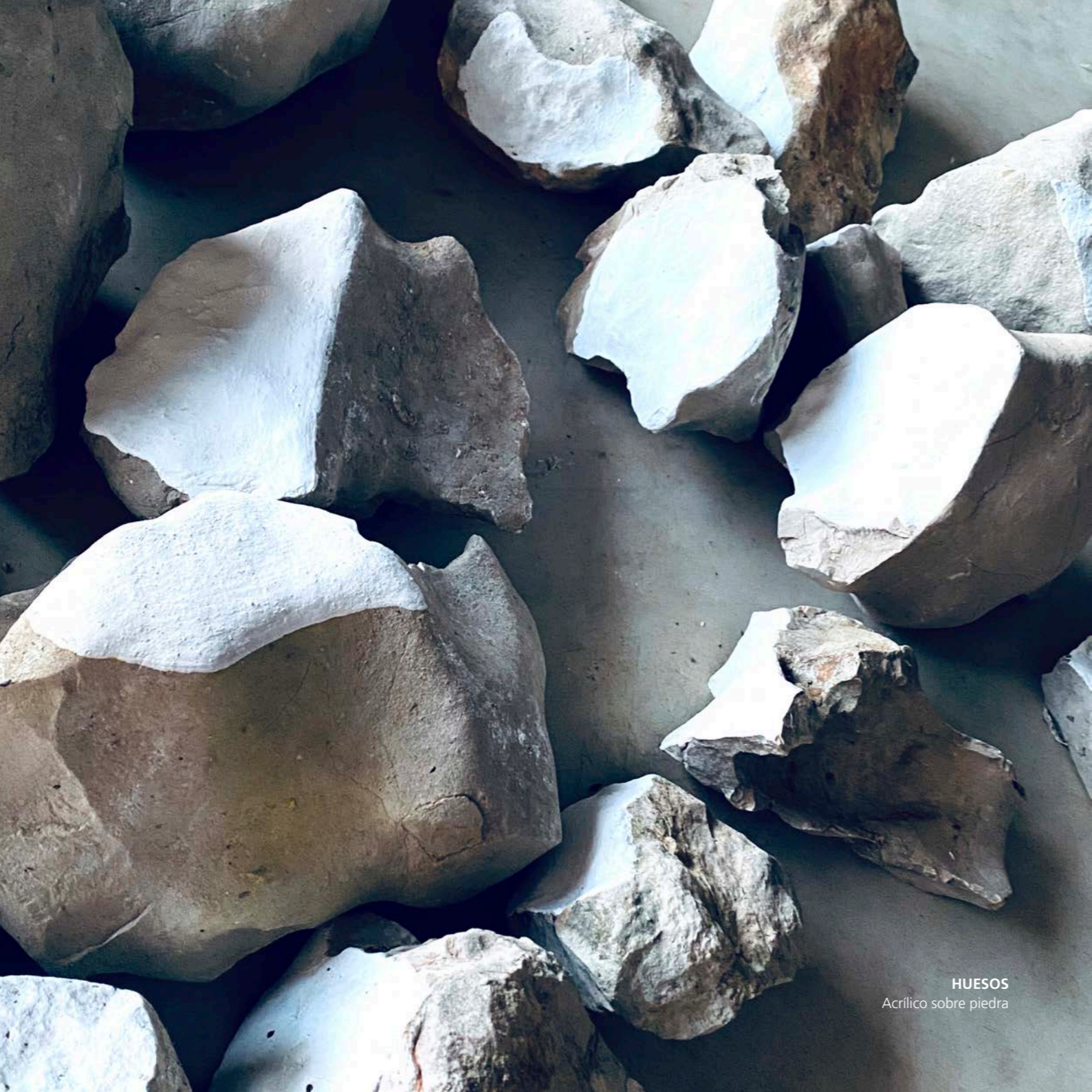
HUESOS Acrílico sobre piedra

Cada espacio nos cuenta historias; el Molino de Uldecona es un icono del territorio que representa la antropología y la naturaleza de este lugar. Así, esta exposición más allá de expresar lo que dicen las piedras, también honra este lugar y se integra con su historia. Las piedras hablan de olivos, y de montañas que emergen en medio del territorio como una fortaleza.