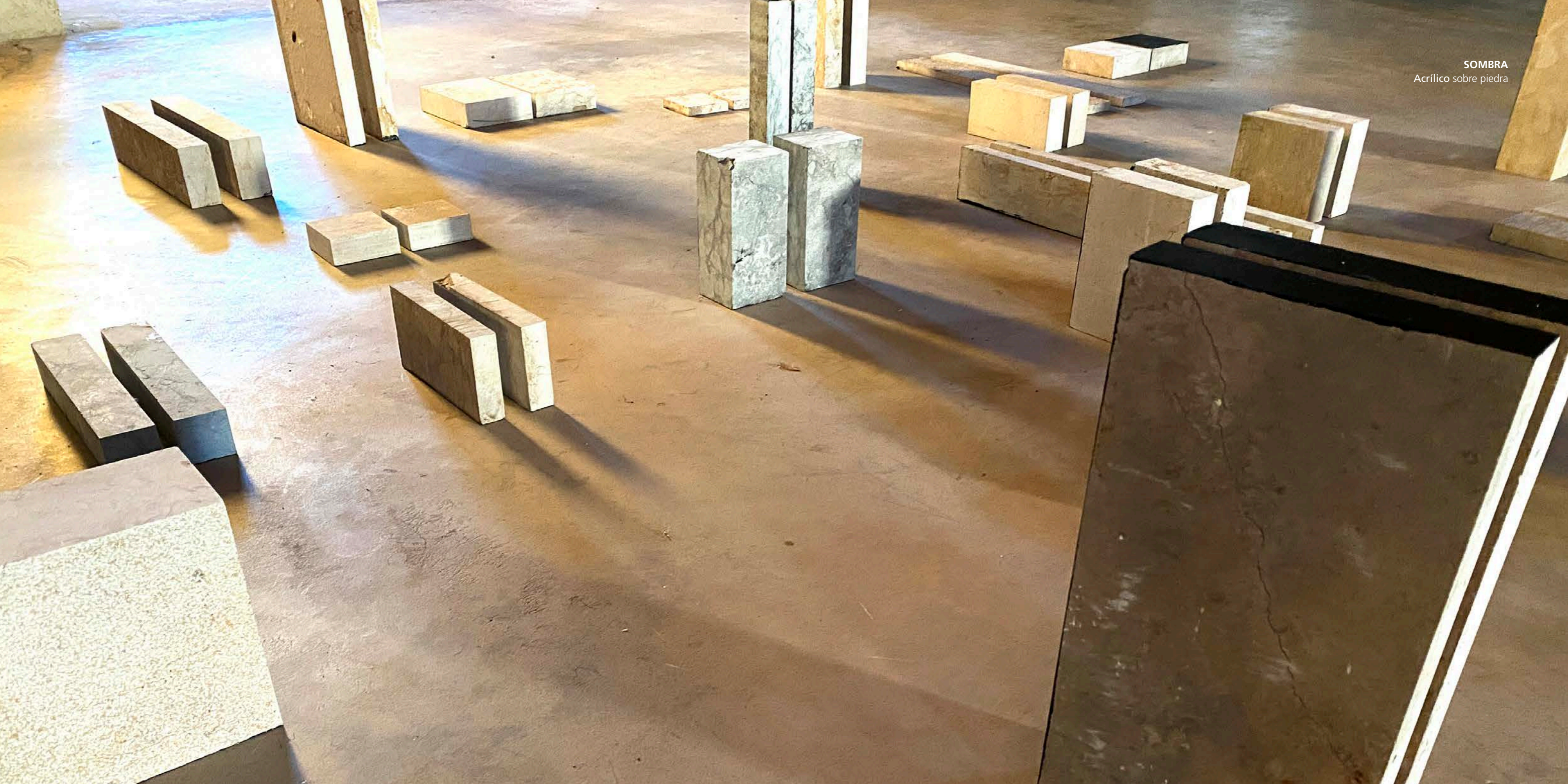
SOMBRA Acrílico sobre piedra