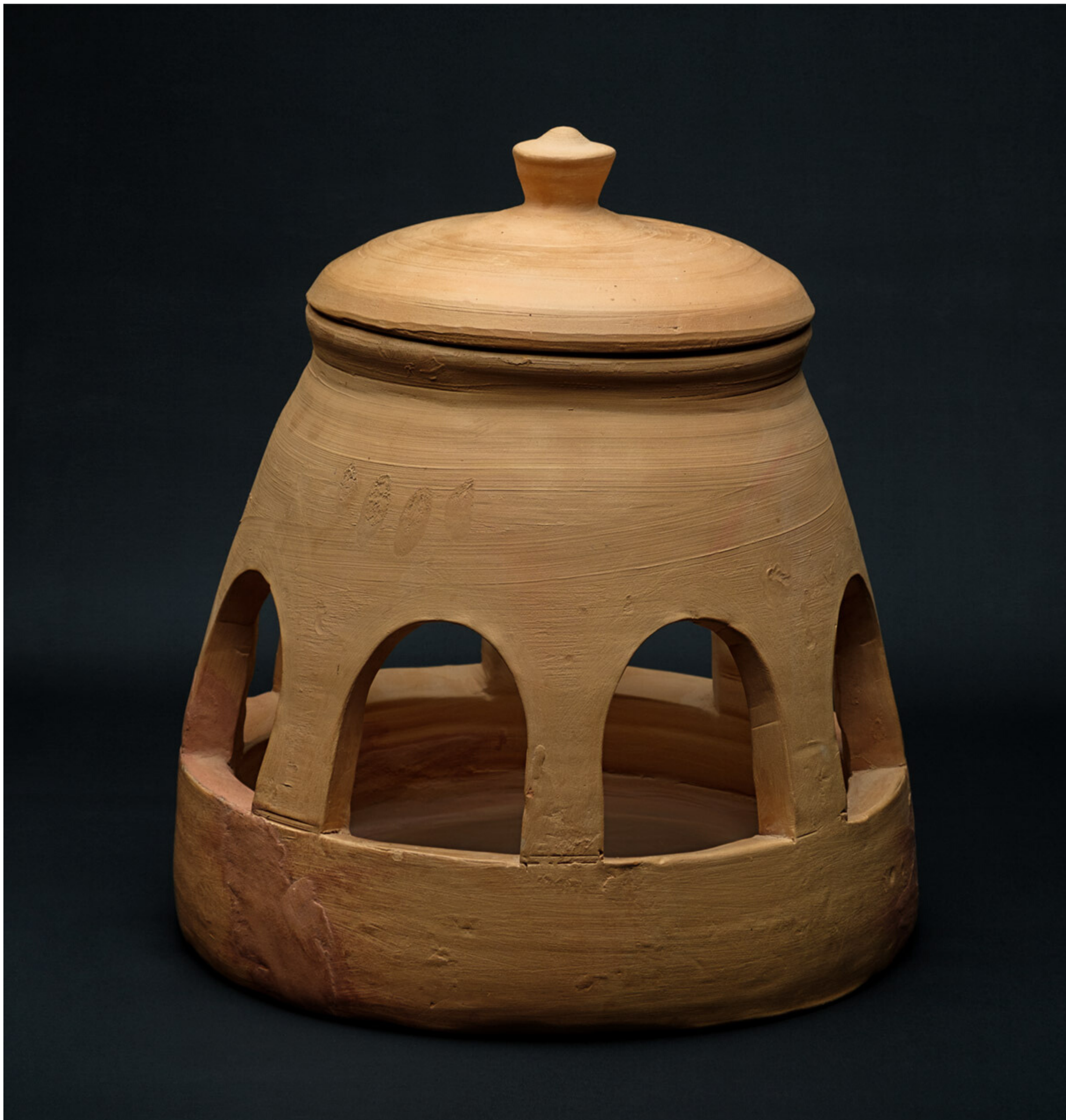
Menjadora de coloms o altres petites aus Terra cuita sense vidriar Ø30 cm x 27 cm